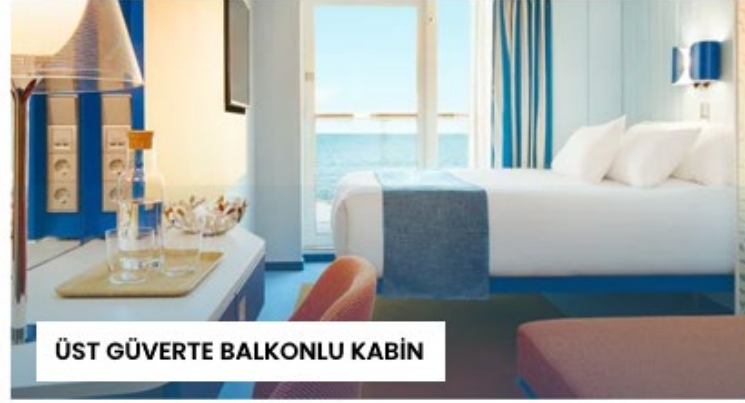
ÜST GÜVERTE BALKONLU KABİN

Kabin Özellikleri: İki adet tek kişilik yatak veya bir büyük yatak, özel banyo ve duş, minibar, televizyon, telefon, saç kurutma makinesi ve kasa. Klasik kabinler geminin ilk güverte üzerinde yer almaktadır.