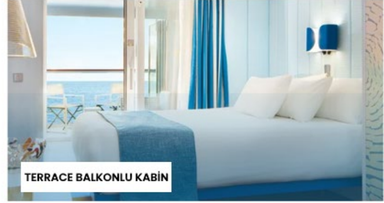
TERRACE BALKONLU KABİN

Not: Sigara içilmesi kabinlerde yasaktır, ancak kül tablaları kullanılması durumunda balkonlarda izin verilir.